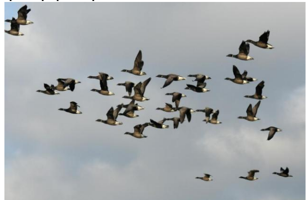
Bernaches cravants : photo Damien Hubaut

Observations de nombreuses espèces d'oiseaux d'eau en hivernage dans le delta Rhin-Meuse-Escaut. Le groupe logera à l'hôtel Terminus de Goes, mais les chambres individuelles seront éventuellement logées à l'hôtel Van der Valk à 3 km de là. Prévoir vêtements chauds imperméables , bottes, gants, bonnet, écharpe, jumelles et longue-vue si vous en possédez une, ainsi que le pique-nique du samedi.