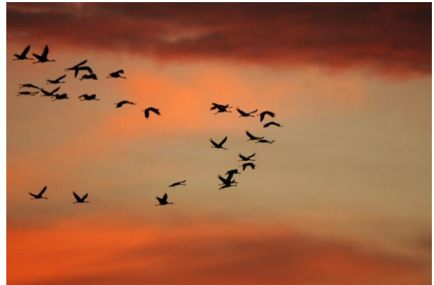
Grues cendrées

renaud.delfosse@skynet.be ou info@lahulpenature.be