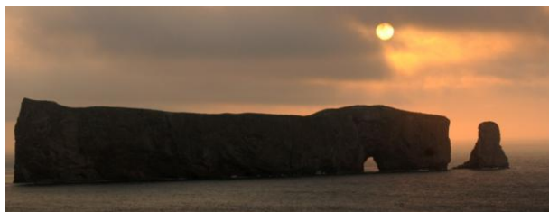
Le rocher percé