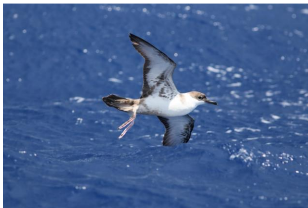
Puffin d'Audubon

Plus de 900 espèces d'oiseaux sont observées annuellement aux Etats-Unis. Citons d'abord quelques espèces typiques comme le Cardinal, le Colibri à gorge-rubis, l'Hirondelle noire ou le Geai bleu avant de s'échapper dans les marais chauds et humides du Sud-Est, Nous visiterons ensuite une partie unique de cette côte-Est américaine que sont les « Outer-Banks ». Constitués d'une fine bande de terre et de sable (200-900 m de large) au large de la Caroline du Nord, ils s'étendent du nord au sud sur plus de 350 km. Ce territoire très particulier est un havre pour des espèces nicheuses comme le Bec-en-ciseaux noir, le Pluvier de Wilson, le Chevalier semi-palmé, ou le Pélican brun. Il est aussi la principale route migratoire de la côte-Est, ainsi qu'un lieu d'hivernage important pour le cygne siffleur et de nombreux canards.