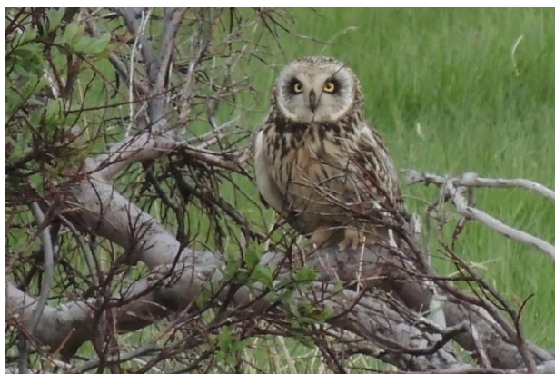
Hibou des marais