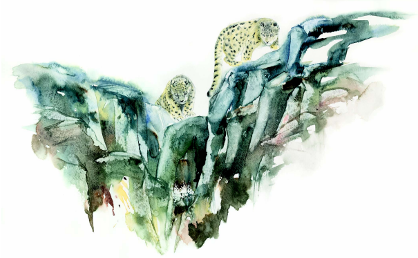
Panthere des neiges ; aquarelle : Yves Fagniard

Entre défi logistique et défi humain, à plus de 4500 mètres d'altitude dans des conditions de terrain extrêmes, l'approche du fantomatique félin ne se gagne qu'au prix d'une motivation bien déterminée, mais au delà des images, des scènes uniques de comportement et de ses aquarelles, Yves Fagniard nous livre, aussi et surtout, un témoignage fort et une réflexion profonde sur les liens qui unissent les bergers tibétains à l'insaisissable prédateur et à la faune sauvage.