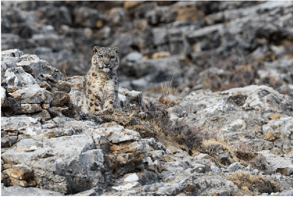
Panthere des neiges ; photo : Yves Fagniard

Entre défi logistique et défi humain, à plus de 4500 mètres d'altitude dans des conditions de terrain extrêmes, l'approche du fantomatique félin ne se gagne qu'au prix d'une motivation bien déterminée, mais au delà des images, des scènes uniques de comportement et de ses aquarelles, Yves Fagniard nous livre, aussi et surtout, un témoignage fort et une réflexion profonde sur les liens qui unissent les bergers tibétains à l'insaisissable prédateur et à la faune sauvage.