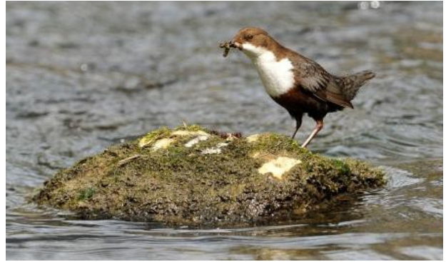
Cincla plongeur

Il nous apprendra l'intérêt des techniques de génétique et de leurs applications à partir de divers exemples concrets sur les cincles, les aigles ou même les condors. Cet exposé didactique s'adresse à tous.