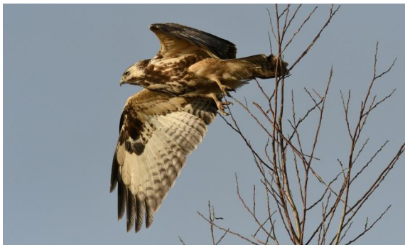
Buse variable : photo Damien Hubaut

Inscriptions via virement pour le 06 janvier 2020, toute dernière limite, sous réserve de disponibilité. Montant à verser au compte Fortis BE80 2100-1345-6477 d'AVES BRUXELLES à 1310 La Hulpe.