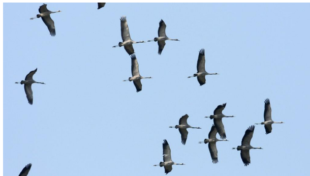
Grues cendrées : photo Damien Hubaut

Un WE en ZELANDE (Pays-Bas) : Les samedi 11 et dimanche 12 janvier 2020.