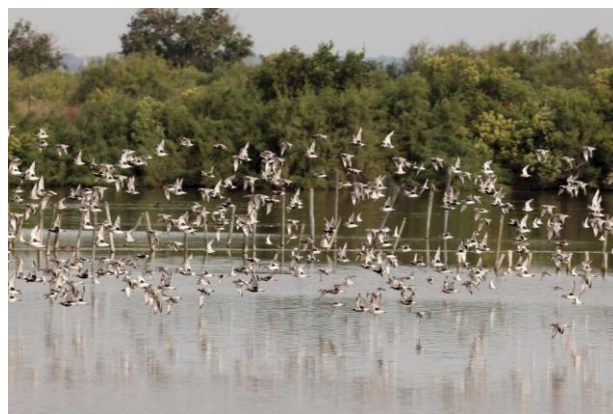
Pluviers argentés au Teich

Nous voici partis pour une série d'observations extrêmement variées. Le col d'Organbidexka, s'il est connu des ornithologues, vaut en effet bien le détour. En cette fin du mois d'août, nous sommes en plein passage migratoire. Il faut bien sûr un peu de chance avec le climat, mais même par temps brumeux ou pluvieux le paysage nous charme. Découvertes botaniques, mais surtout par un jour idéal, le passage de centaines de Bondrées ! Par la suite, nos pas nous conduisent vers la région d'Hendaye...ici, le but est tout autre. Il s'agit de partir en mer à la rencontre des cétacés et oiseaux pélagiques. Le Golfe de Gascogne est évidemment un lieu crucial pour la rencontre avec ces espèces. Puis, nous nous dirigeons vers un marais extraordinaire, qui nous fait compléter la liste des familles d'oiseaux observés. Ici, ô surprise, des Flamants roses, mais aussi quelques espèces moins communes du Midi. Le séjour finira en beauté avec la découverte de la réserve du Teich... venez découvrir ce spectacle varié ce 9 janvier !