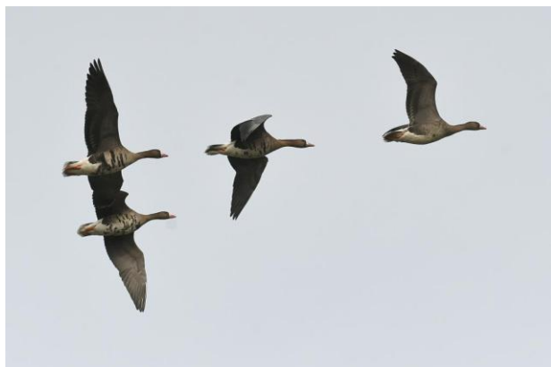
Oies rieuses

Inscriptions via virement pour le 14 janvier 2024, toute dernière limite, sous réserve de disponibilité. Montant à verser au compte Fortis BE80 2100-1345-6477 d'AVES BRUXELLES à 1310 La Hulpe.