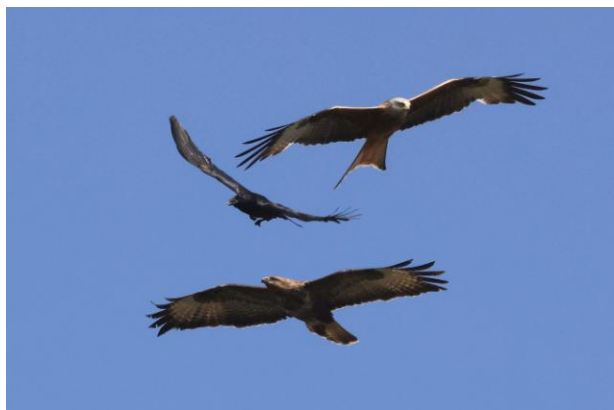
Milan royal, corneille noire et buse variable

Ce séjour mis au point en juin 23 avec Défi-Nature nous a enchanté: partis du Pas-de-Calais où parmi les 80 espèces observées nous avons « coché » le Chevalier bargette, nous prenons le Ferry et de Douvres nous rejoignons la fameuse réserve de Slimbridge, étape incontournable pour un guide du Zwin et ses ouailles. Après cette belle découverte, nous rejoignons Hamersford au Pays de Galles, avec quelques buts bien précis. Observation vespérale des Puffins des anglais, une journée passée sur la merveilleuse île de Skomer, où les Macareux moines passent entre nos pieds sans plus de formalités... Mais aussi, excursion à la découverte de la merveilleuse île de Grassholm, qui accueille moult Fous... de Bassan. La suite du séjour nous fera rencontrer passereaux et pics lors d'excursions à l'intérieur du pays. Mais notre programme n'aurait pas été aussi extraordinaire sans l'observation d'un nid de Balbuzard « à l'anglaise » et l'observation de 300 Milans royaux juste au-dessus de notre tête !