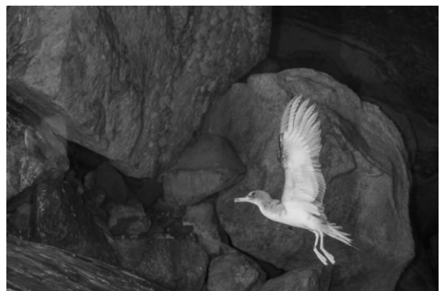
Puffin du Cap-vert