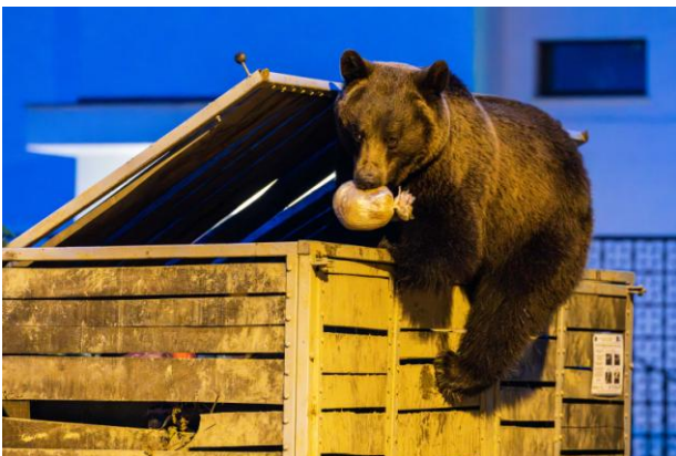
Ours brun

Partez à la découverte de la faune sauvage des villes et villages européens. De Berlin à Vienne en passant par Budapest, Thomas Jean, photographe animalier et créateur de La Minute Sauvage, est parti à la rencontre du castor, du raton laveur et même de l'ours en pleine ville ! Après avoir longuement exploré Bruxelles, il était temps pour lui de comprendre comment la cohabitation se passait ailleurs. Le milieu urbain est-il propice à la vie sauvage ou est-ce l'activité humaine qui pousse les animaux à s'en rapprocher ? La proximité entre l'humain et la faune sauvage altère-t-elle le caractère sauvage des animaux ? Autant de questions à se poser lors de cette conférence sur la faune sauvage des villes européennes.