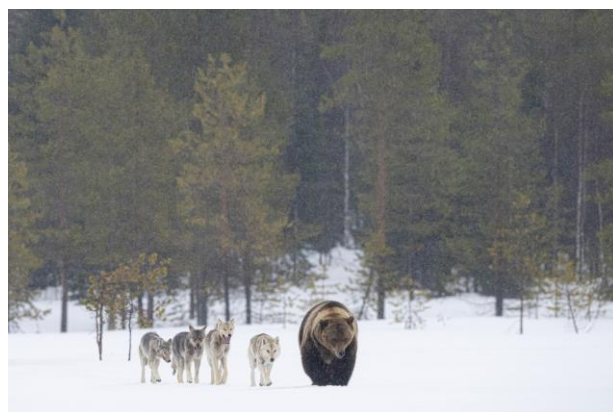
Loups d'Europe et Ours brun