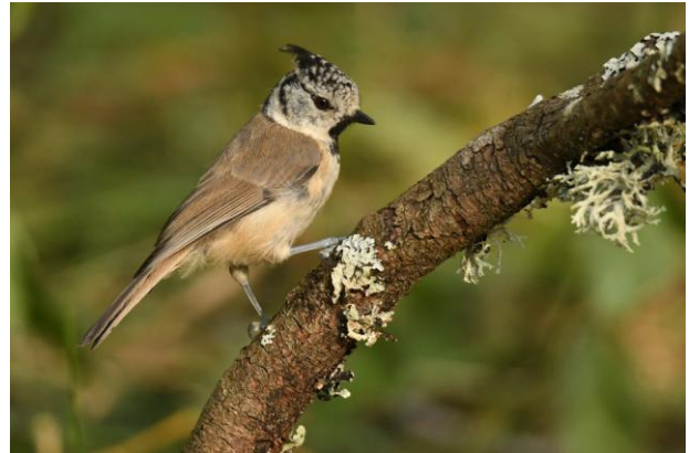
Mésange huppée

cités (listes rouges, living planet index) ? Est-ce que tout cela colle avec l'idée que vous vous en faites à priori ? A-t-on des raisons de perdre espoir ou au contraire faut-il rester motivé pour compter les oiseaux (et agir pour leur conservation !) ? Nous examinerons toutes ces questions d'une manière ludique, sous la forme d'un quizz. Et nous en profiterons pour tirer un bilan provisoire de l'Atlas des oiseaux à Bruxelles !