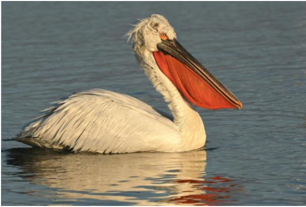
Pélican frisé

d'hivernage du Érismature à tête blanche en Grèce. Parmi les autres espèces que nous rechercherons dans cet endroit, on peut citer le Cygne de Bewick,